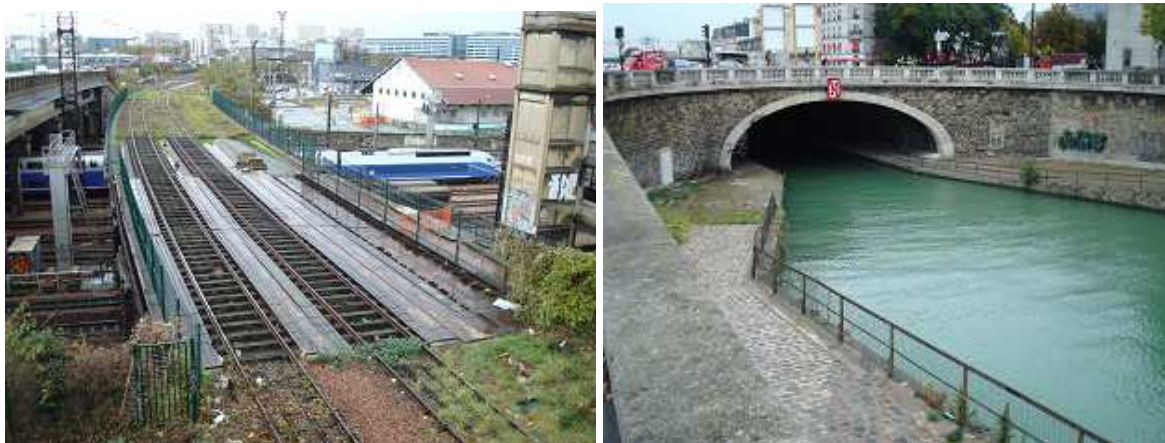
La zone bois de Vincennes/Bercy-Charenton (12 e ) et les canaux (19 e )