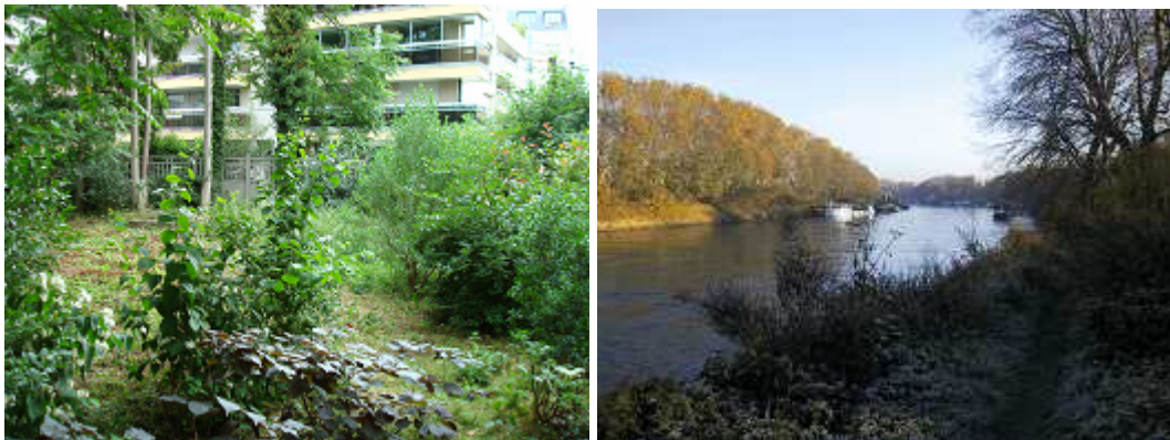
Le cimetière du Père-Lachaise (20 e ) et les berges de la Seine dans le bois de Boulogne (16 e )

Les quatre sites-pilotes sont : les canaux et alentour, dans le 19 e arrondissement ; le bois de Vincennes / Bercy-Charenton, dans le 12 e arrondissement ; le cimetière du Père-Lachaise et alentour (11 e et 20 e arrondissements) ; les berges de la Seine dans le bois de Boulogne, dans le 16 e arrondissement.